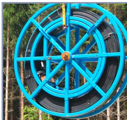
Haspel mit aufgerolltem Stahlseil