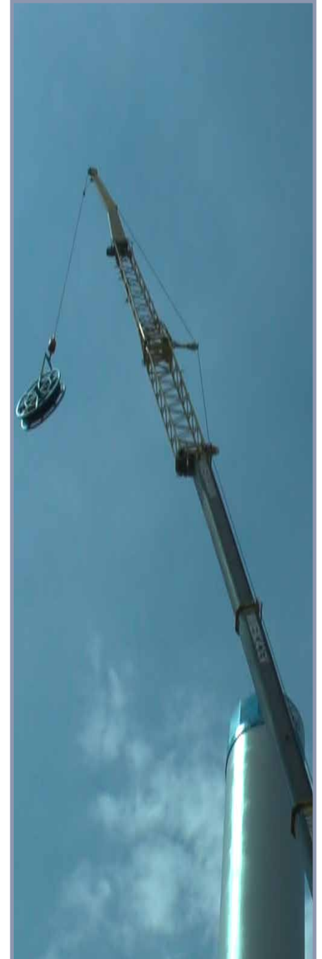
Transport der Haspel zur Turmspitze